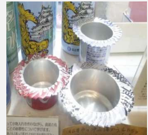
アルミ缶を利用した「アルミCAN-CAN」