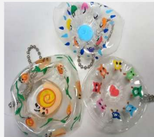
ペットボトルを利用した「ペットホルダー」

※ペットボトルやアルミ缶を利用したリサイクル工作を通してごみや資源について学びます。