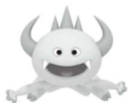
マスコットキャラクター「コパ」

名古屋市環境学習センター（エコパルなごや）は、「環境」について楽しみながら体験し、考え学ぶことができる無料の施設です。土日祝日も開館しておりますので、ぜひお越しください。詳しくは、裏面や「エコパルなごや」のホームページをご覧ください。